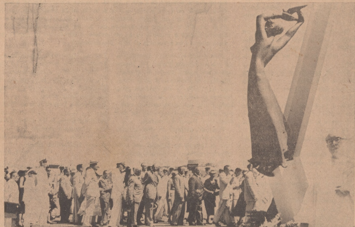
Despues di e ceremonia impresionante cu a tuma lugar Diasabra mainta tur esnan presente a desfila dilanti di e monumento y dilanti di e plaachi cu e nombrenan graba. Hopi hende a probecha di es ocasion y a pone nan bouquet di flor. Riba e potret aki tambe nos por forma un idea di e altura di e monumento en comparacion cu e altura di e hendenan.

Nos ta convivi qu nan famia den nan dolor y nos ta spera qu esaqui lo por dunanan forza den nan resignacion.